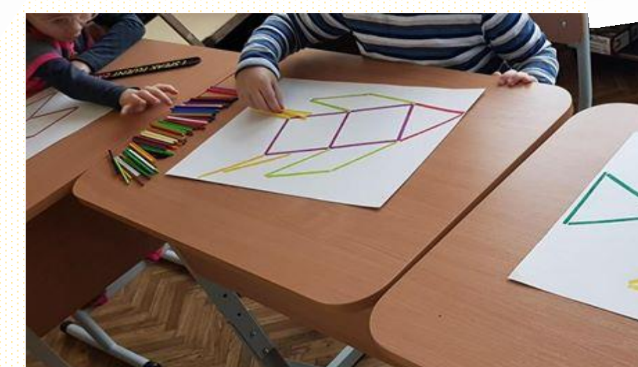
Artikuliacijos ir smulkiosios motorikos lavinimas