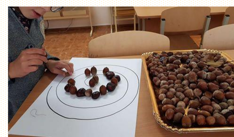
Smulkiosios motorikos pratysbos