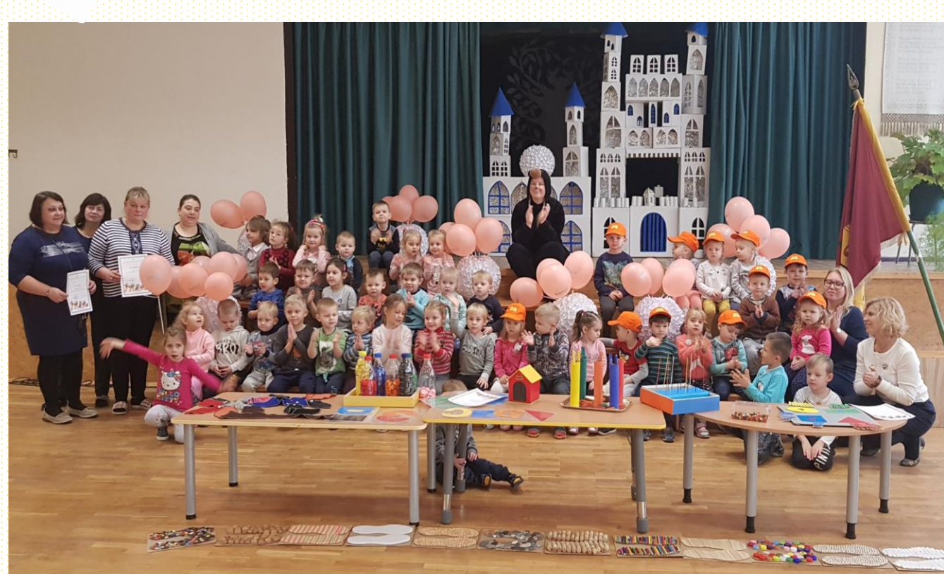
Pasitelkiant kalbos raiškos elementus: sekant pasaką, vaidinant ir žaidžiant su auklėtojų sukurtais priemonėmis.