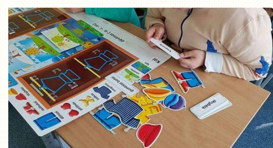
Pažintinių gebėjimų ugdymas