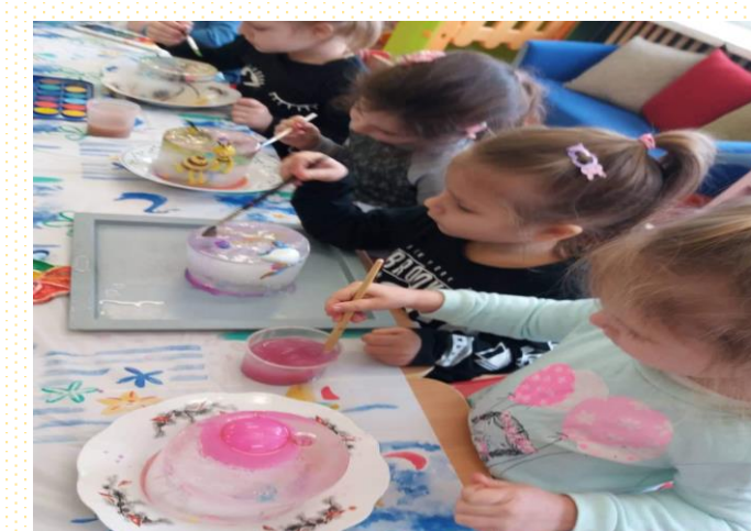
Kūrybinė veikla, taikant patirtinius ugdymo metodus