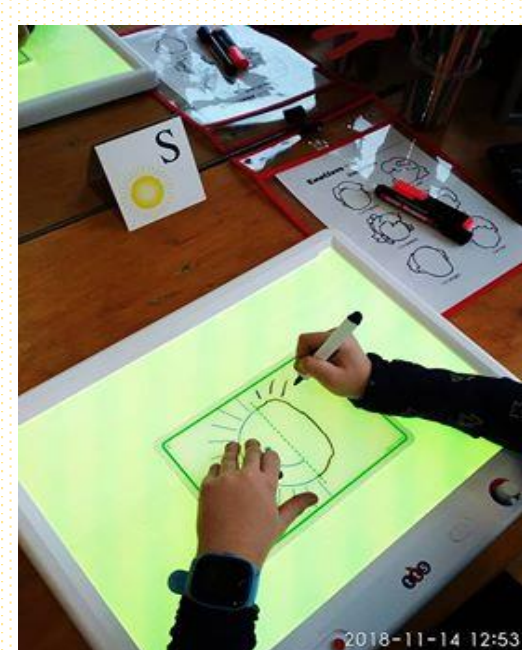
Erdvės ir regimojo suvokimo ugdymas