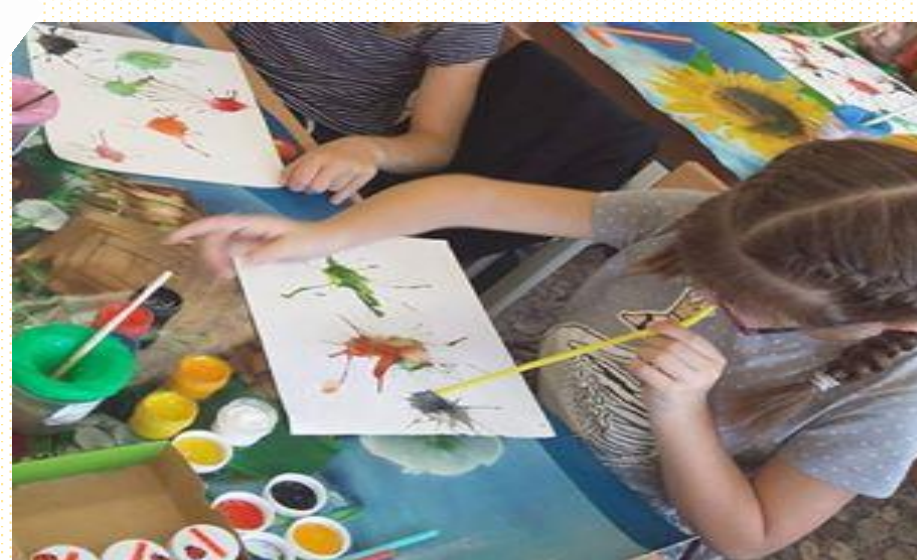
Kalbinio kvėpavimo ugdymas